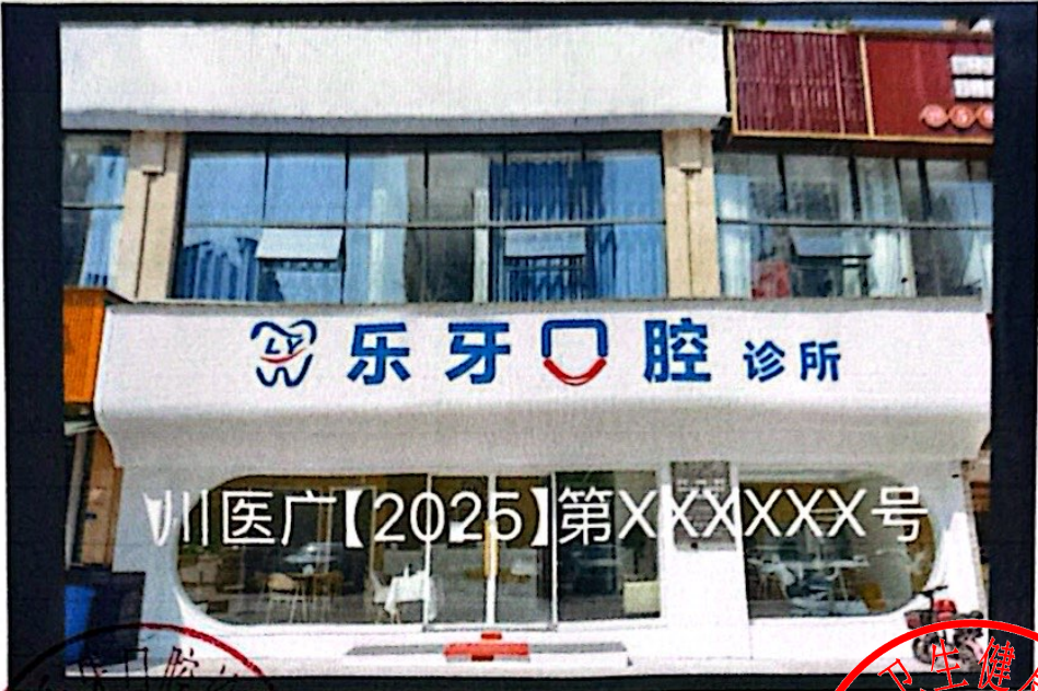
图 (1) 网络