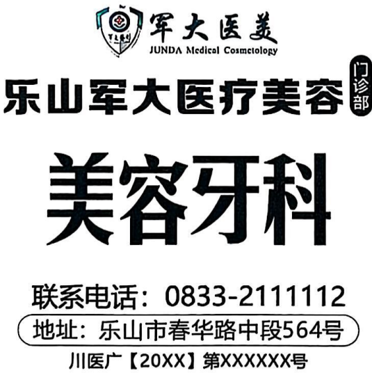
图 (6) 期刊,户外,印刷品,网络