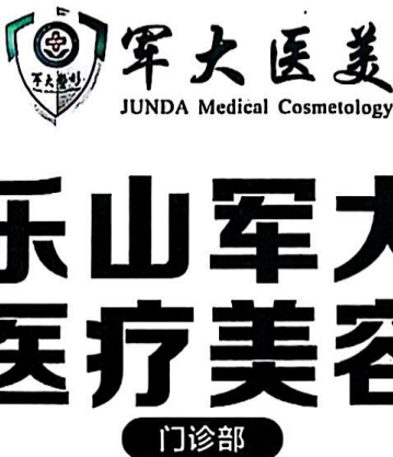
图 (3) 期刊,户外,印刷品,网络

医疗广告发布法律责任：按照《中华人民共和国广告法》第五十五条 违反本法规定，发布虚假广告的，由市场监督管理部门责令停止发布广告，责令广告主在相应范围内消除影响，处广告费用三倍以上五倍以下的罚款，广告费用无法计算或者明显偏低的，处二十万元以上一百万元以下的罚款；两年内有三次以上违法行为或者有其他严重情节的，处广告费用五倍以上十倍以下的罚款，广告费用无法计算或者明显偏低的，处一百万元以上二百万元以下的罚款，可以吊销营业执照，并由广告审查机关撤销广告审查批准文件、一年内不受理其广告审查申请。