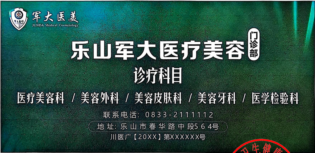
图 (10) 期刊,户外,印刷品,网络