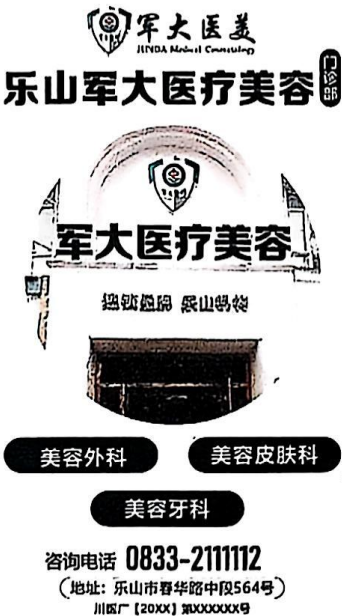
图 (2) 期刊,户外,印刷品,网络