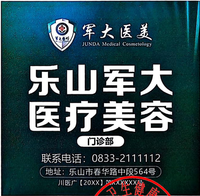
图 (7) 期刊,户外,印刷品,网络