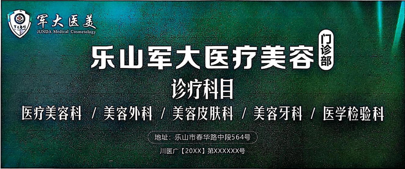
图 (9) 期刊,户外,印刷品,网络