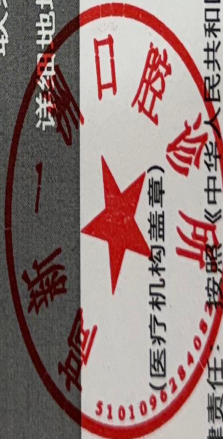
图 (1) 网络