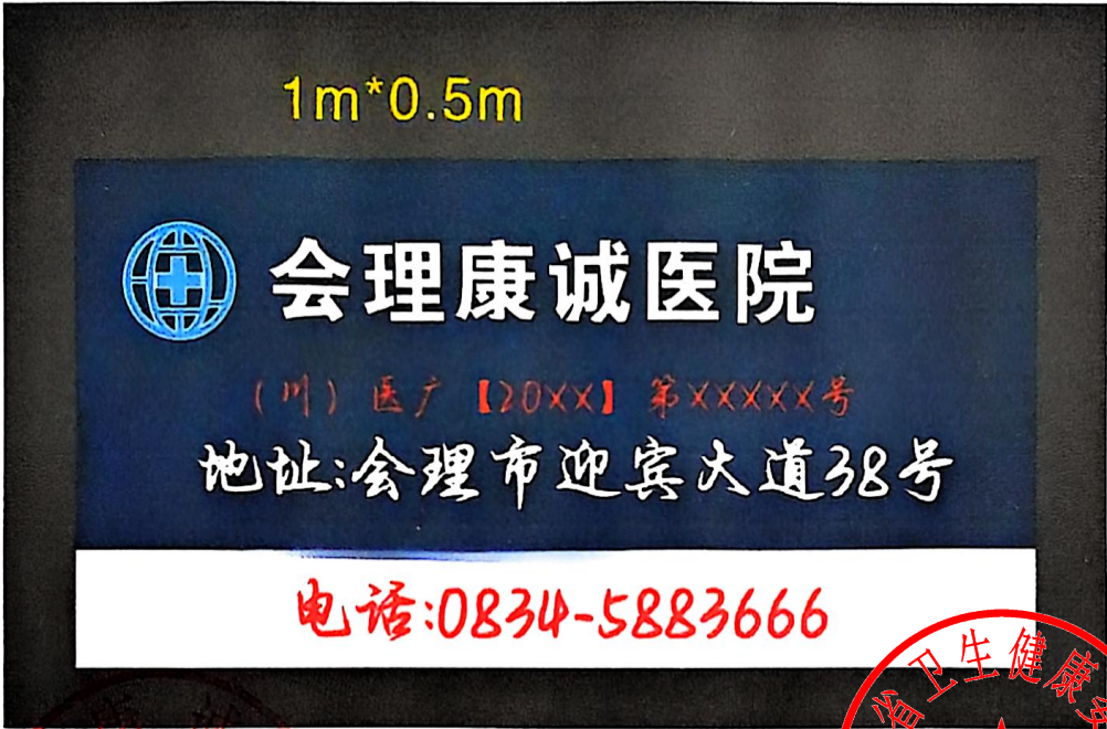
图 (5) 户外,印刷品