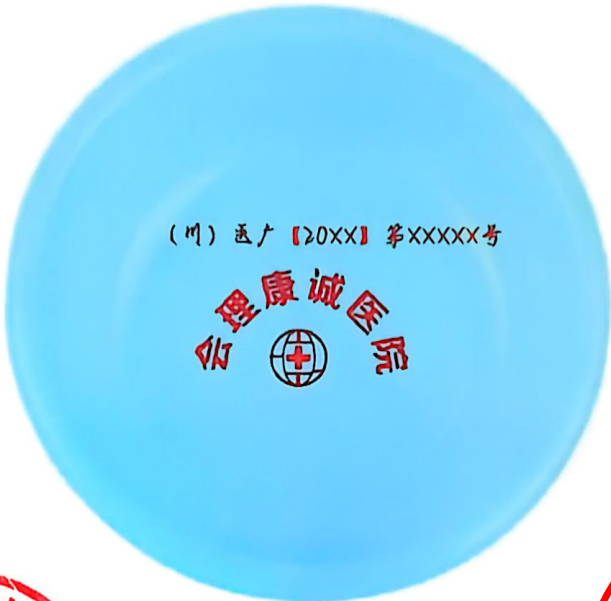
图 (3) 印刷品