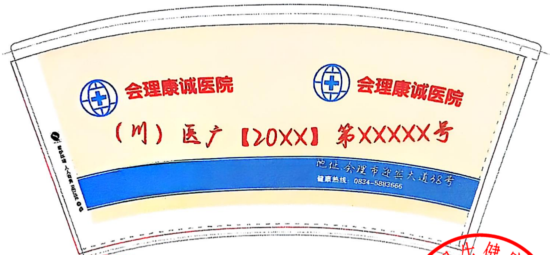
高度：8.8cm 上口：7.5cm 下口：5.2cm