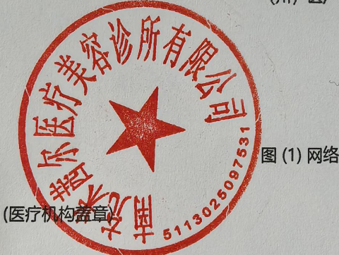
图 (1) 网络