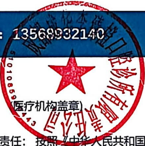
图 (1) 网络