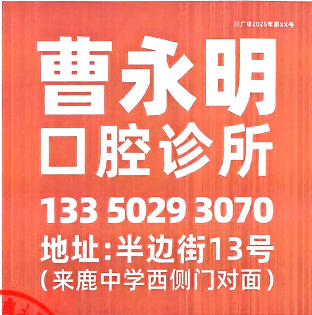
图 (1) 其他