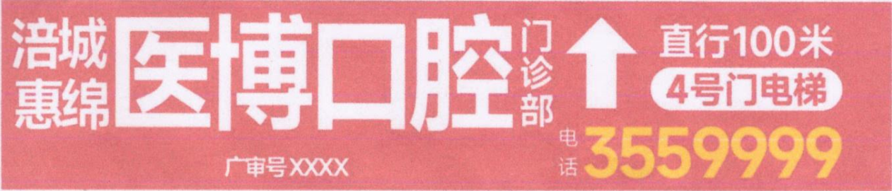
图 (1) 户外