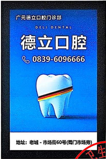
图 (4)