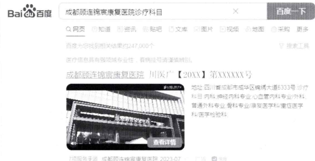
图 (2) 网络