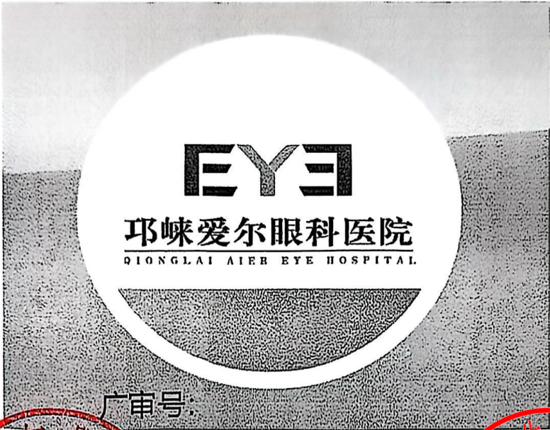
图 (5) 户外,印刷品,网络