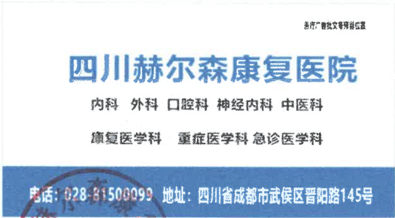
图 (1) 报纸,户外