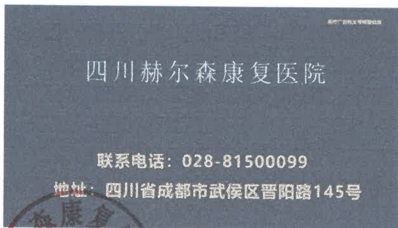
图 (4) 影视