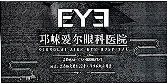
图 (2) 户外,印刷品,网络