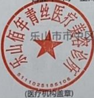
图 (2) 网络