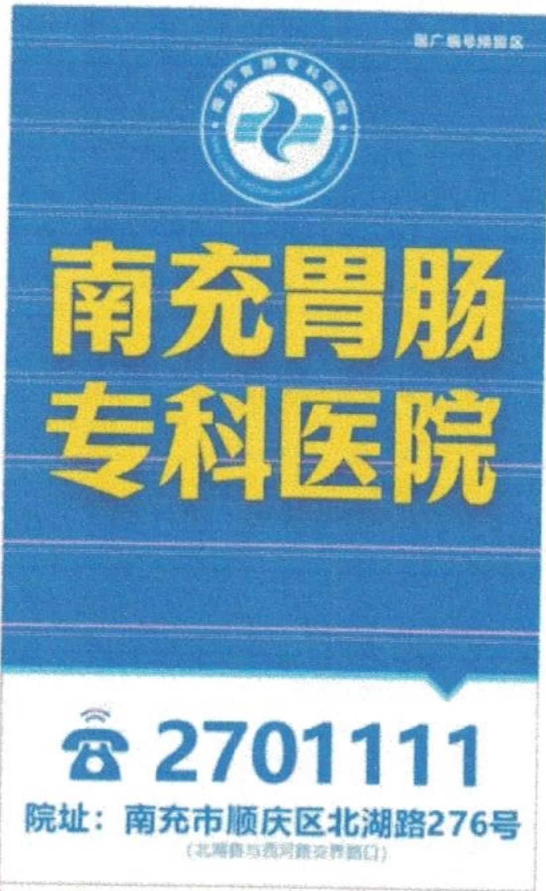
图 (1) 户外