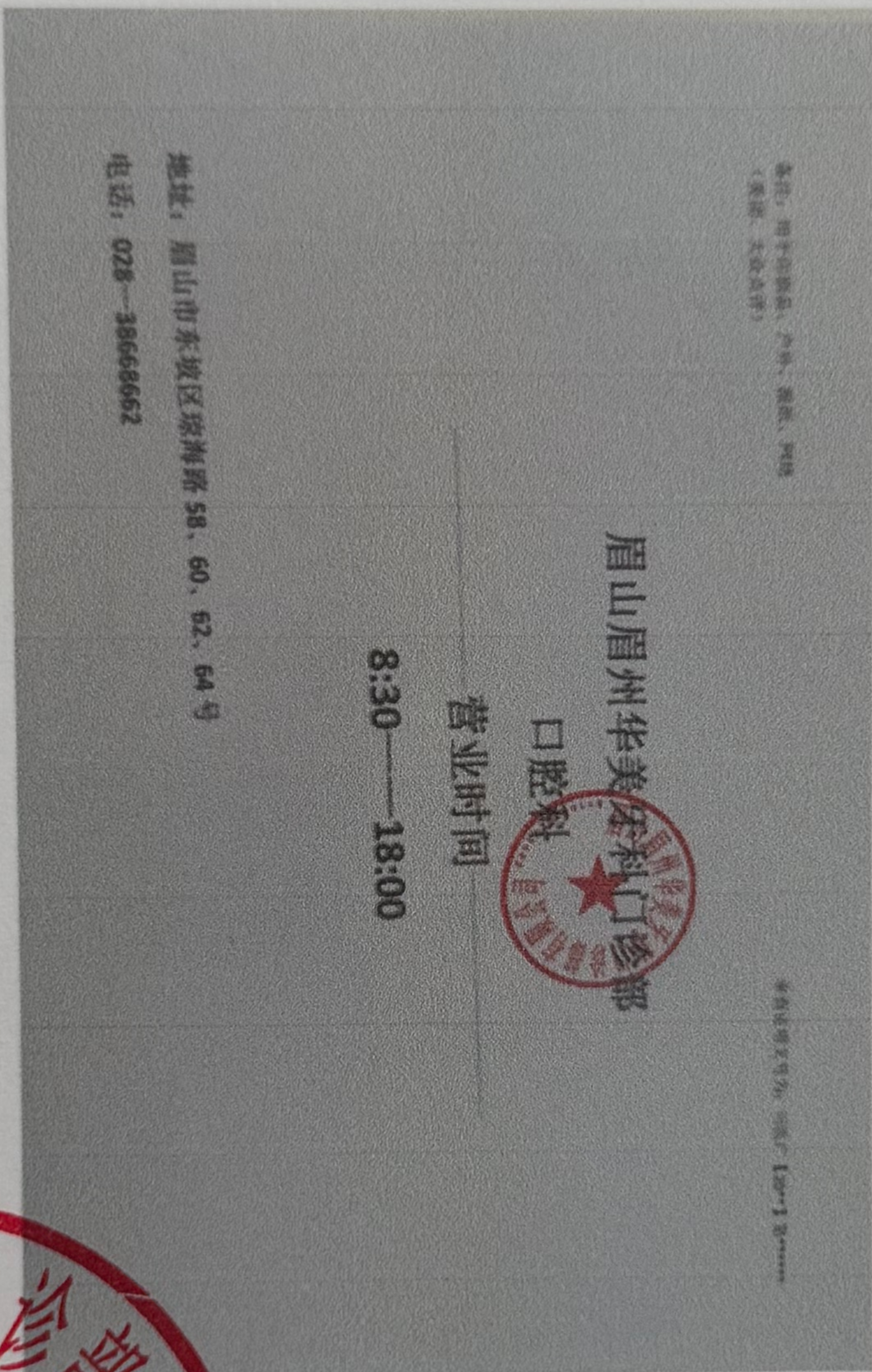
图 (5) 网络