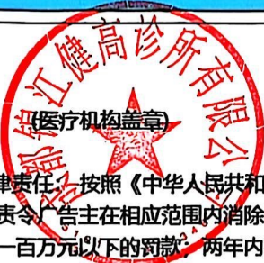
图 (1) 印刷品