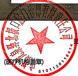
图 (1) 户外,印刷品,网络,其他