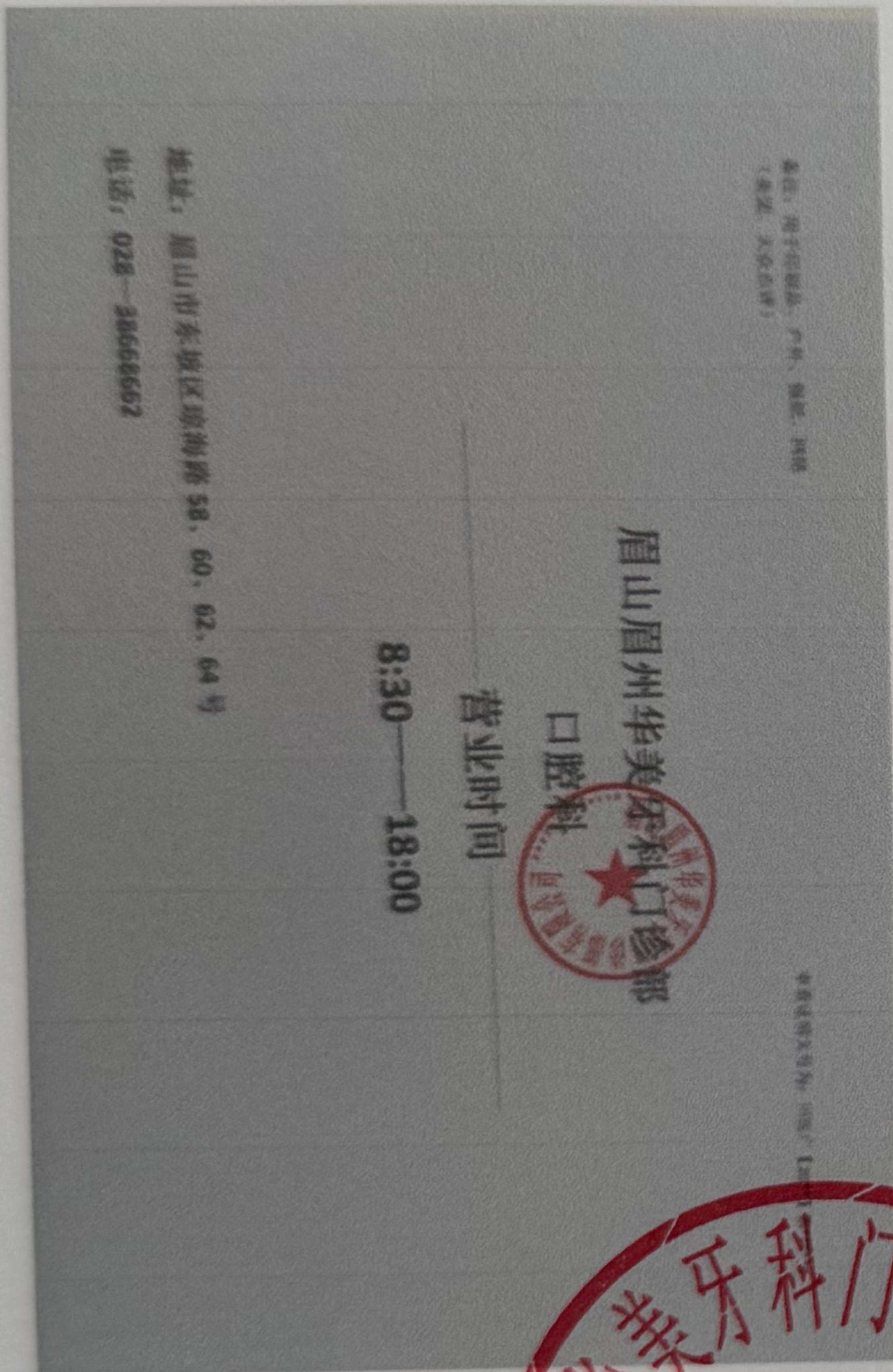
图 (4) 印刷品