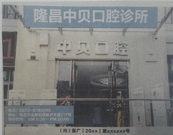
图 (1) 网络