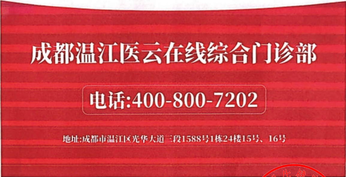
图 (1) 影视印刷品、网络