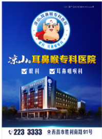
图 (3) 户外,印刷品