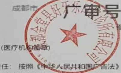
图 (1) 网络