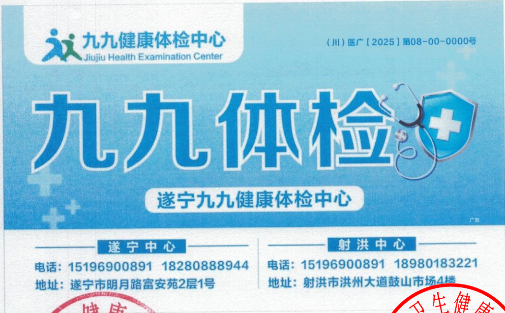
图 (2) 户外