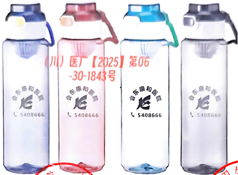
图 (3) 印刷品