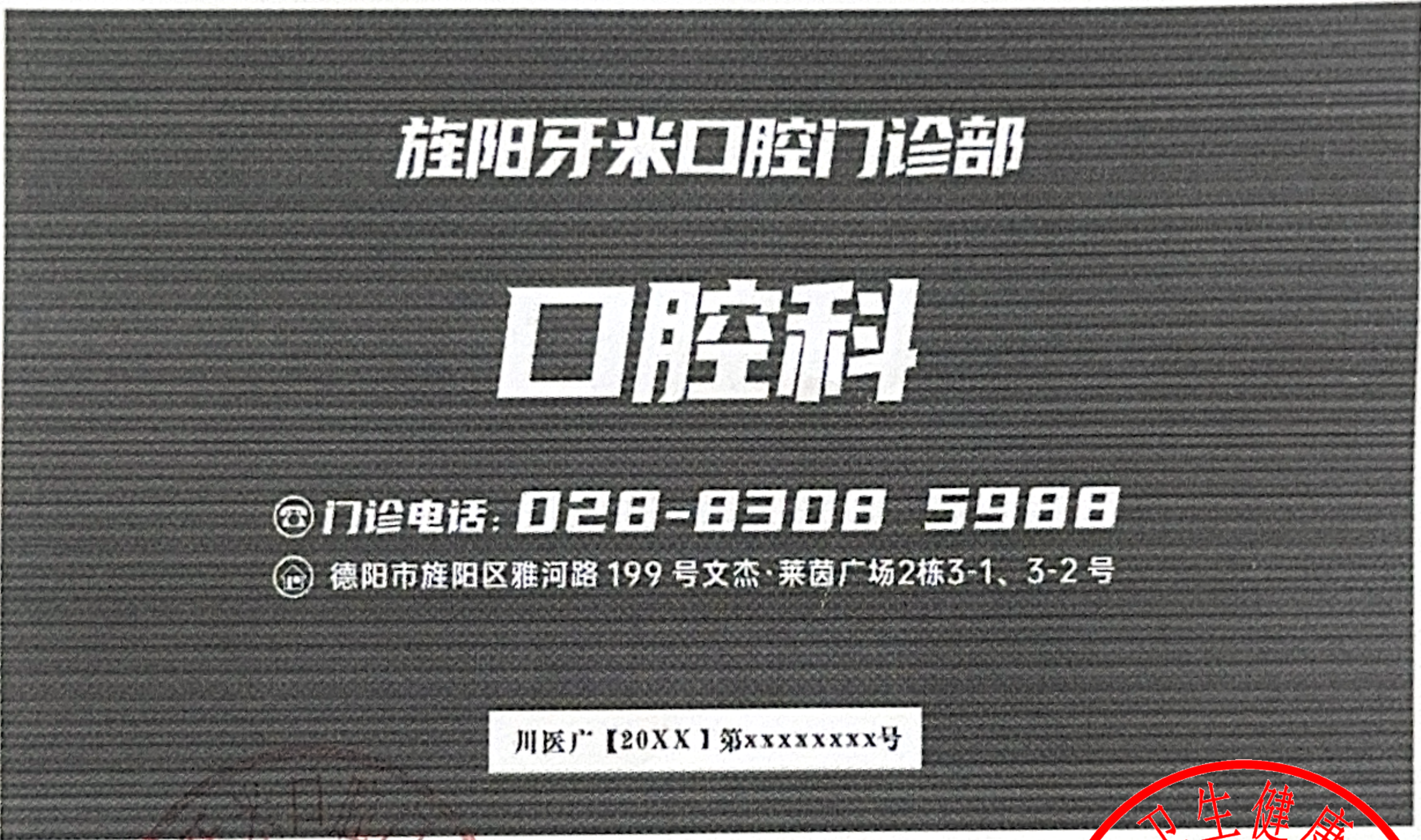
图 (1) 户外,印刷品,网络,其他