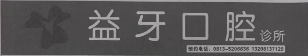
图 (1) 印刷品,网络