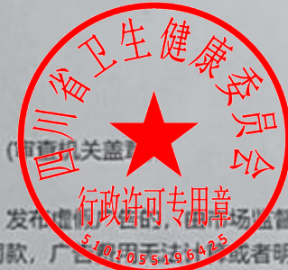
图 (2) 网络

医疗广告发布法律责任: 按照《中华人民共和国广告法》第五十五条 违反本法规定,发布虚假广告的,由市场监督管理部门责令停止发布广告,责令广告主在相应范围内消除影响,处广告费用三倍以上五倍以下的罚款,广告费用无法计算或者明显偏低的,处二十万元以上一百万元以下的罚款;两年内有三次以上违法行为或者有其他严重情节的,处广告费用五倍以上十倍以下的罚款,广告费用无法计算或者明显偏低的,处一百万元以上二百万元以下的罚款,可以吊销营业执照,并由广告审查机关撤销广告审查批准文件,一年内不受理其广告审查申请。 医疗机构有前款规定违法行为,情节严重的,除由市场监督管理部门依照本法处罚外,卫生行政部门可以吊销诊疗科目或者吊销医疗机构执业许可证。 按照《中华人民共和国广告法》第五十八条 有下列行为之一的,由市场监督管理部门责令停止发布广告,责令广告主在相应范围内消除影响,处广告费用一倍以上三倍以下的罚款,广告费用无法计算或者明显偏低的,处十万元以上二十万元以下的罚款;情节严重的,处广告费用三倍以上五倍以下的罚款,广告费用无法计算或者明显偏低的,处二十万元以上一百万元以下的罚款,可以吊销营业执照,并由广告审查机关撤销广告审查批准文件,一年内不受理其广告审查申请: (一) 违反本法第十六条规定发布医疗、药品、医疗器械广告的; (二) 违反本法第十七条规定,在广告中涉及疾病治疗功能,以及使用医疗用语或者易使推销的商品与药品、医疗器械相混淆的用语的。