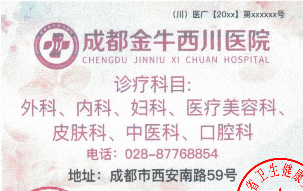
图 (1) 影视,广播,报纸,期刊,户外,印刷品,网络,其他