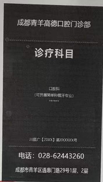
图(1) 报纸、期刊、户外、印刷品、网络