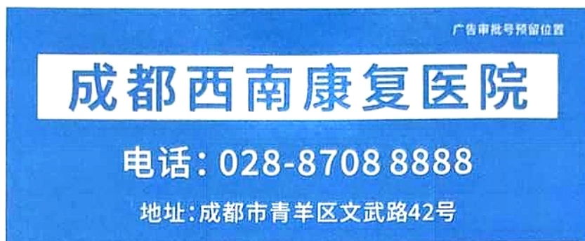
(2) 成都西南康复医院公交站台广告成品样件（规格：92*138cm）