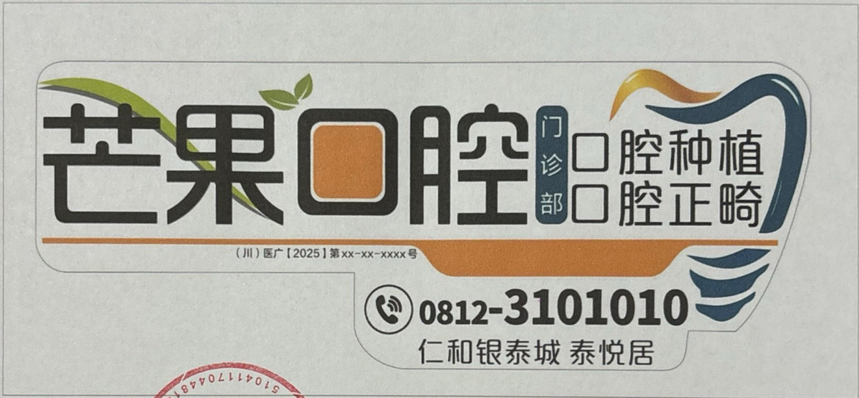
图 (1) 报纸、期刊、户外、印刷品、网络